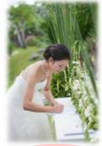
挙式証明書の署名