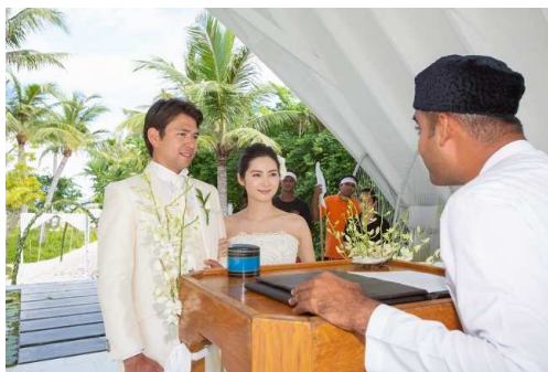
02. … 誓約 …