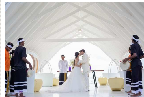
04. … 誓いのキス …