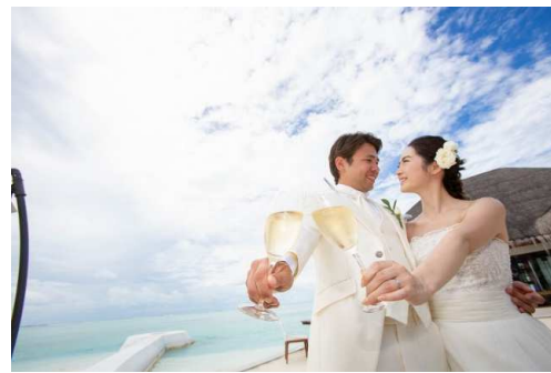
07. … 乾杯 …