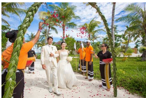
01. … 入場(ポドゥベル演奏)…