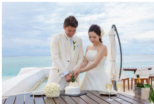
06. … ケーキカット …