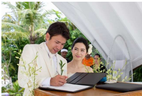
05. … 署名 …