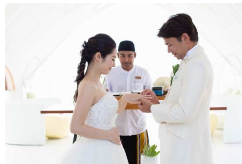
03. … 指輪交換 …