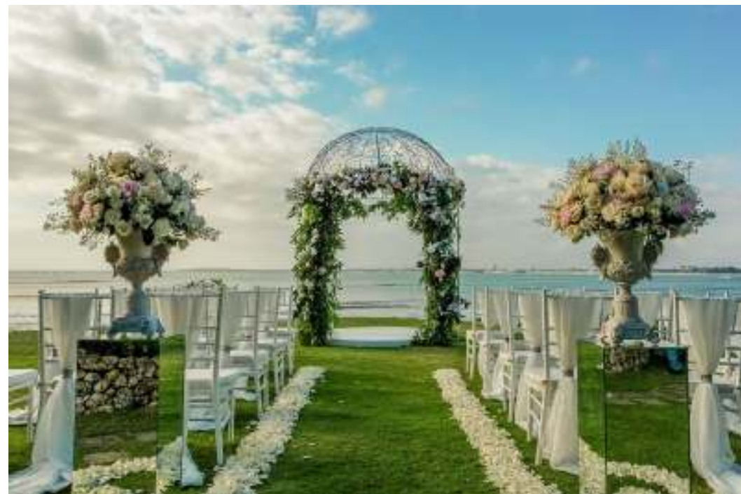
ギリジンバラン挙式