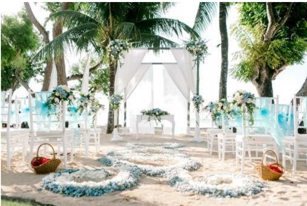
ココナツグローブ挙式