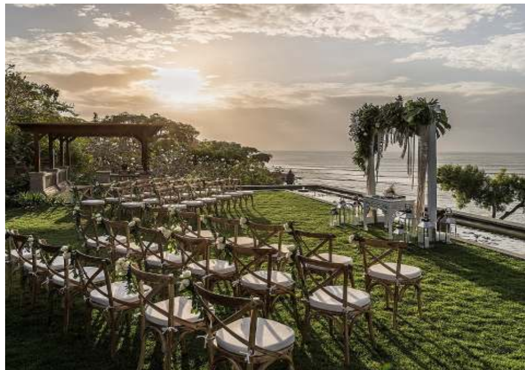
インペリアルヴィラ挙式