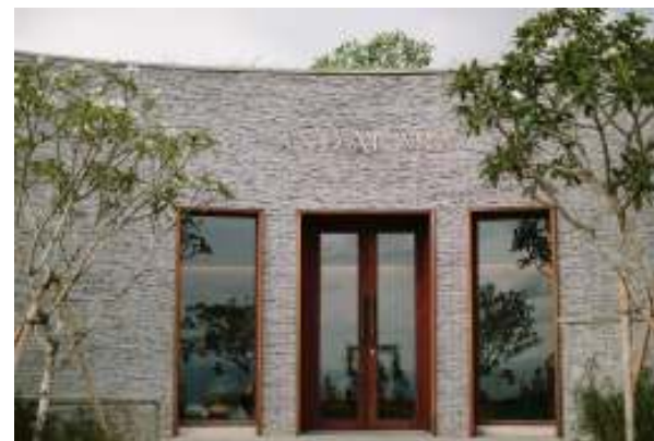
アンダカラ挙式専用お仕度部屋