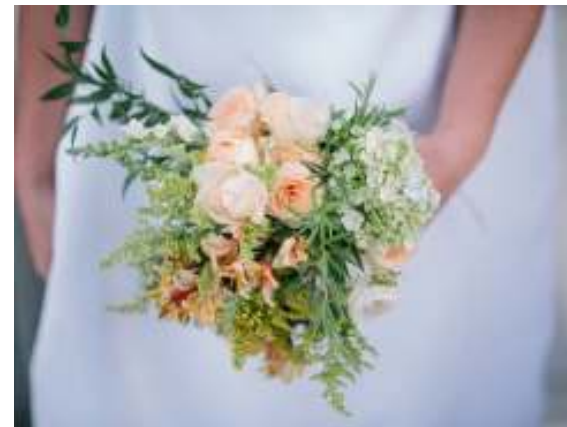
ナチュラルクラッチブーケ