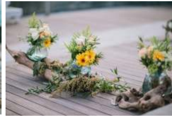
シックスセンステイストのナチュラル素材を 生かしたデコレーション