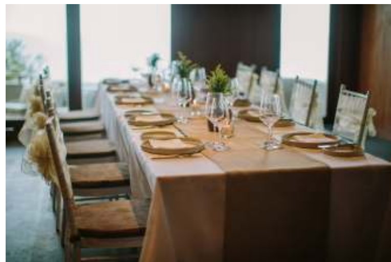
テーブルデコレーション (イメージ)