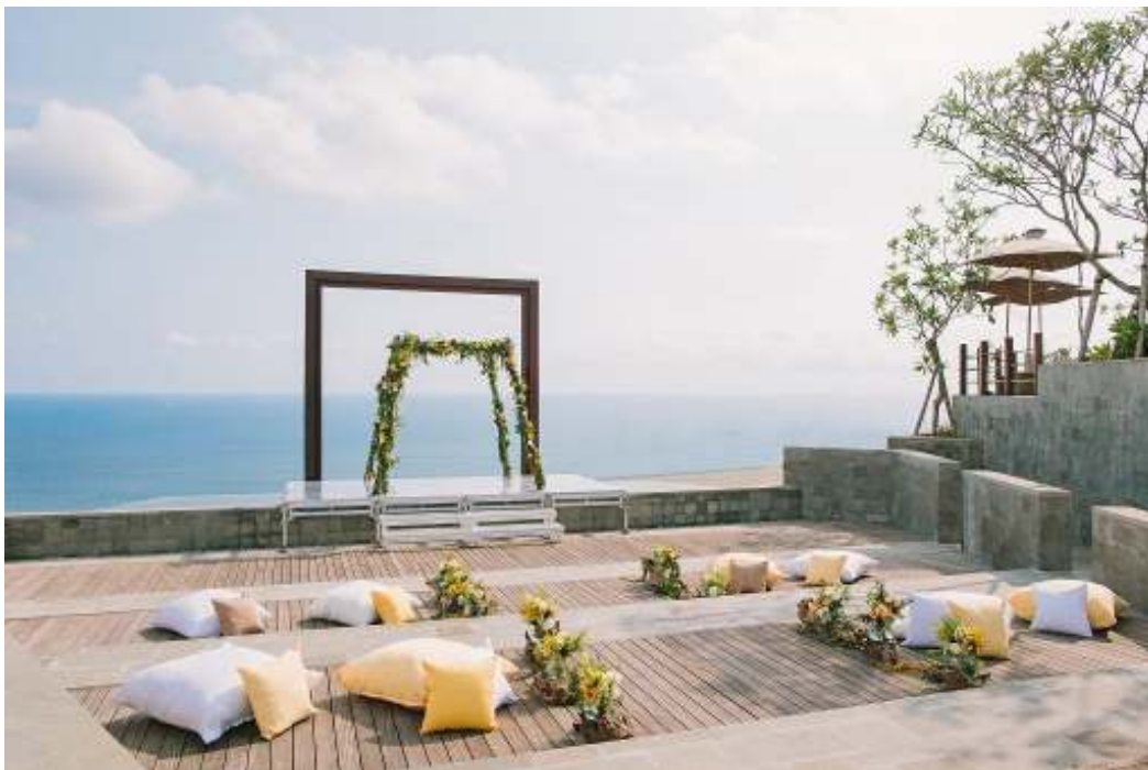
シネマ・パラディソ