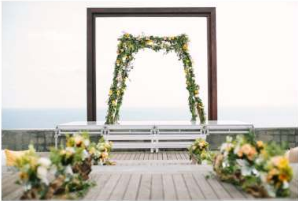
会場デコレーション

星空の下で映画鑑賞を楽しめるスペースがお二人のウェディングステージとなります。参列者様はクッションにお座りいただき映画の主人公のお二人を見守り、個性的なウェディングシーンを演出します。