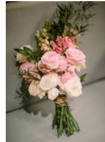
ナチュラルクラッチブーケ