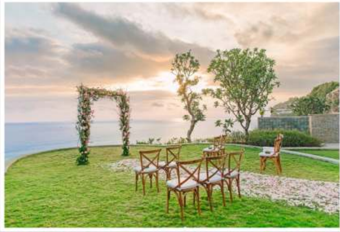
会場デコレーション

インド洋を見渡す完全プライベートスペースでのウェディング。 ナチュラルに木々を重ね合わせたウェディングアーチやバッククロスチェアは、バリならではの自然な空間を 贅沢に演出します。